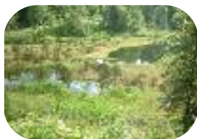
Le Luitel - Juin 2011