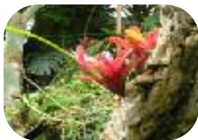
Serres de Grenoble - Juin 2011