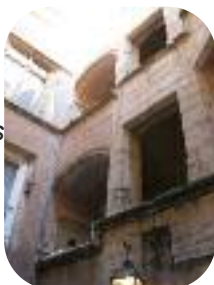
Lyon - Avril 2011 - Traboules