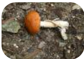
Sortie Mycologique - sept 2011