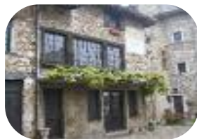
Pérourges - nov 2011