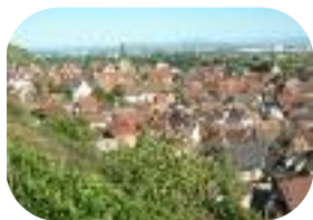
Türkheim -alsace sept 2011