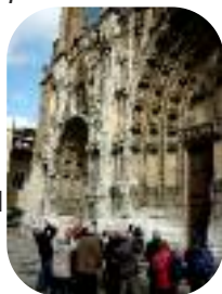
Vienne - Mars 2011