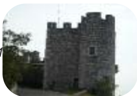
Basse pente du Rabot-sept 2011