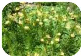
Col du Lautaret - Juillet 2011